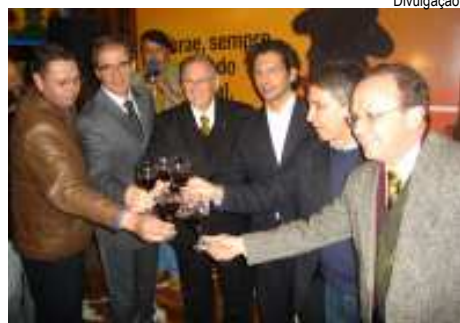
... e do Vinho de Urugaiana

Com o centro cultural projetado por Oscar Niemeyer, o município quer firmar-se como um pólo irradiador de cultura, devido a sua localização privilegiada no pampa gaúcho.