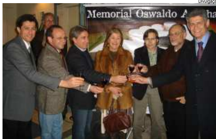
Autoridades participam do lançamento do projeto do Memorial Oswaldo Aranha de Alegrete...