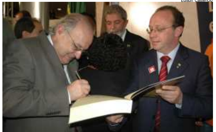
Ministro Vannuchi, presidente Lula e Villa