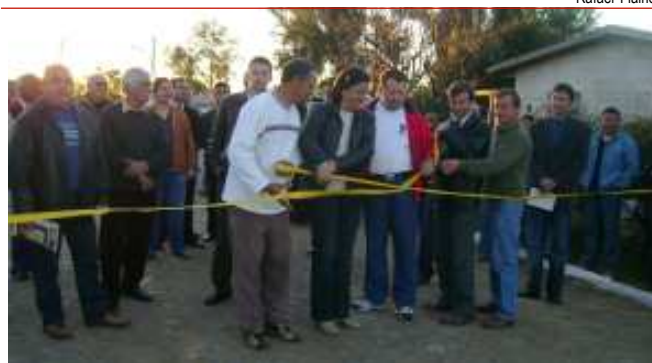
Desenlace da fita simbolizou a entrega da pavimentação

Segundo o prefeito, este tipo de investimento possibilita a urbanização da cidade, e conseqüentemente resgata a auto-estima do cidadão. Maher relatou ainda que a administração municipal está trabalhando intensamente voltado para a urbanização e desenvolvimento do município, pulverizando os recursos