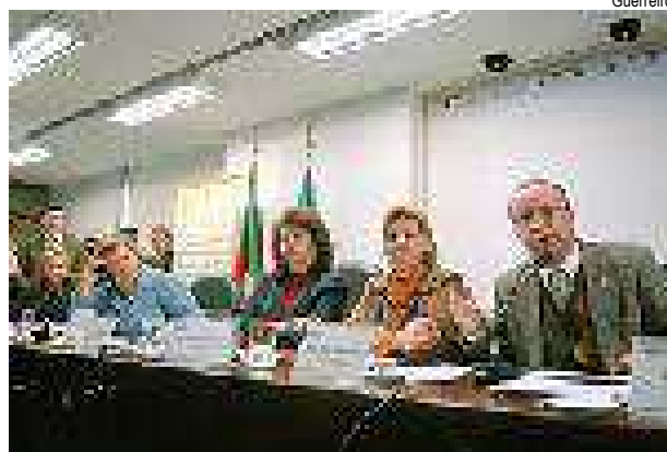
Villa fala sobre enturmação na audiência pública

“Considerar gastos em educação como meras despesas é o equívoco primário desta concepção que remete para a prática da falta de investimentos em áreas de políticas públicas